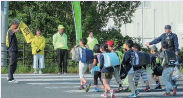
登校時の見守り活動

は船上小学校を管内に受け持っており、朝通学路の交通監視を行っている、子どもたちが横断歩道を渡る際、必ず左右をしつかりと確認してから道路を渡るなど、非常に交通ルールに対する意識が高