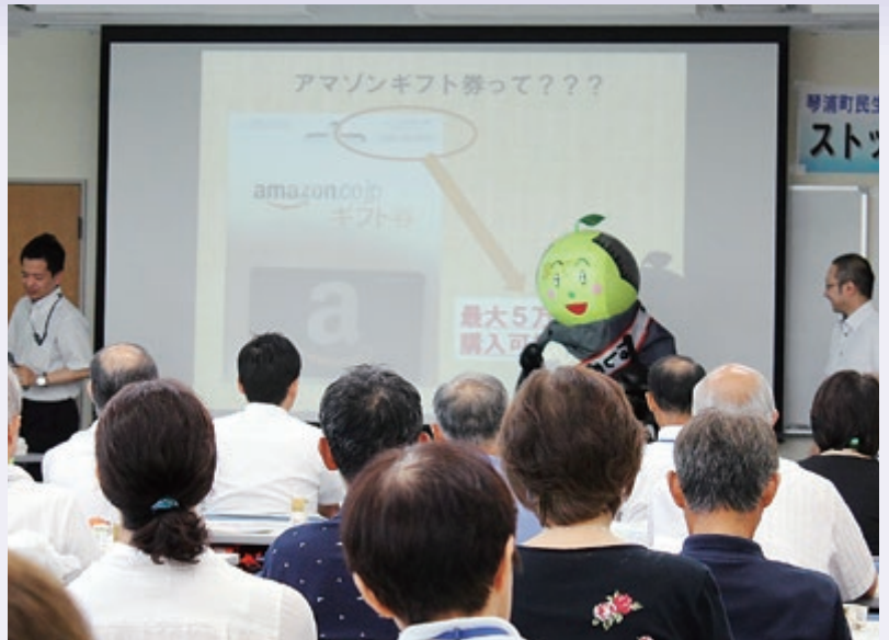
琴浦町民生・児童委員協議会の詐欺被害防止研修会