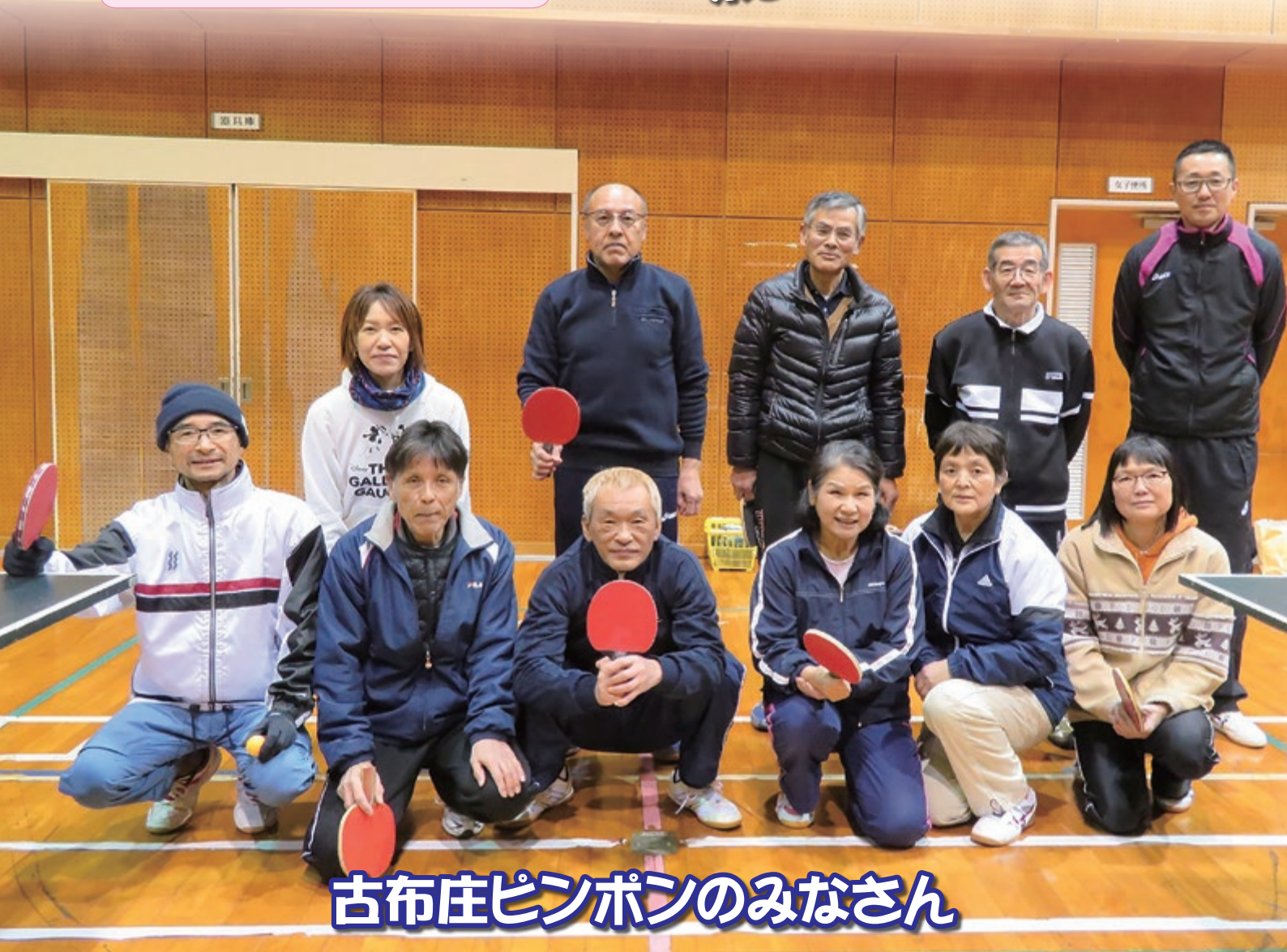
古布庄ピンポンのみなさん