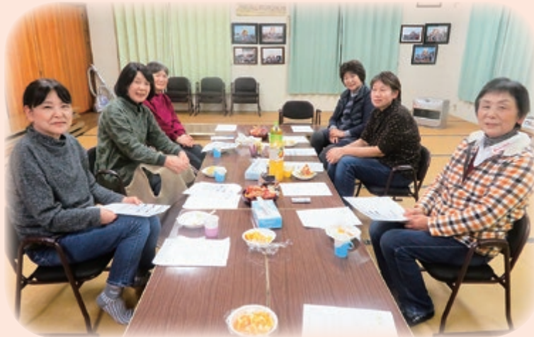
活動の振り返り(仲之町サロン)

気ごろの知れた仲間でお茶を飲みながらわいわいできるのが楽しい。健康づくりや認知症予防にもなるので若い世代にも声をかけながら地域の仲間同士で活動をつづけていきたい。