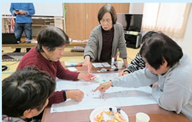
支え愛マップ作成のようす (三保)