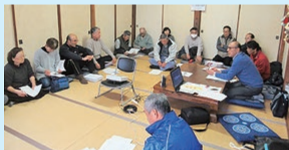
福祉座談会のようす (下三本杉)