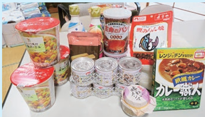
寄付による食品提供