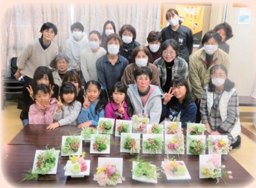
お花を使った創作活動(坂の上サロン)

趣味や健康づくりなどの集まりを通して、地域の住民同士の交流機会として、ふれあい・いきいきサロンがあります。参加してみることで顔なじみとなり、支え合える関係を築くきっかけとなる場でもあります。