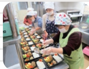
調理ボランティアさんの活動の様子