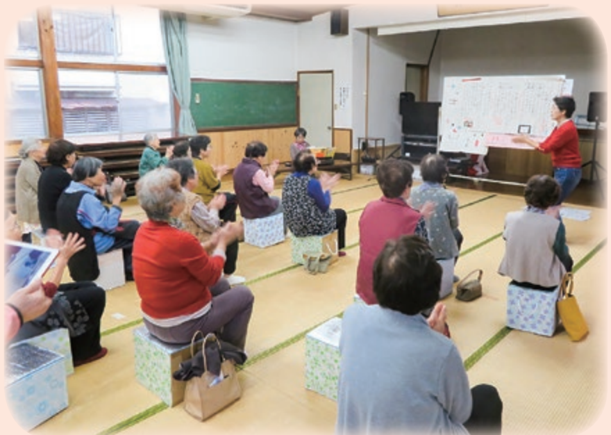
脳トレで認知症予防(徳万サロン)

そしてなによりも、顔なじみの仲間が定期的に集まって活動することで、いきがいや楽しみにつながります。